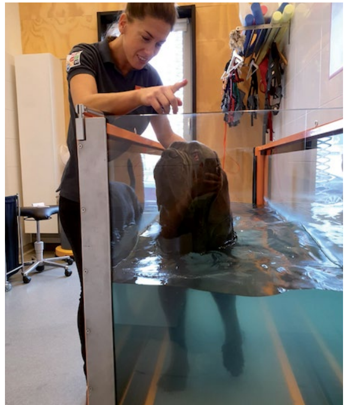
Afbeelding 4: Trainen in de hydrotrainer

zocht en behandeld door de dierenfysiotherapeut. Want waar komt de peesblessure vandaan? Is er bijvoorbeeld sprake van verminderde beweeglijkheid in de wervelkolom? Moet er nog een discipline ingeschakeld worden, zoals de zadelmaker? Als alle neuzen van de disciplines dezelfde kant op staan krijgt het paard uiteindelijk de meest optimale behandeling.