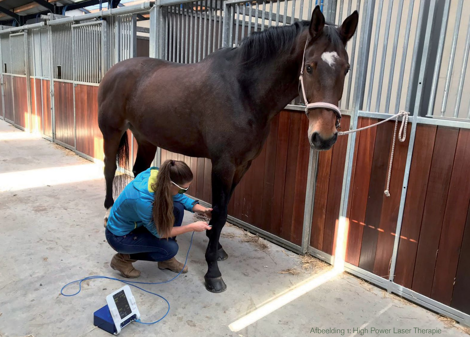
Afbeelding 1: High Power Laser Therapie