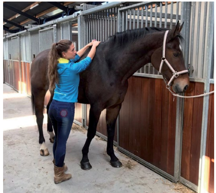
Afbeelding 3: Mobilisaties van de schouder

Als voorbeeld casus nemen we een paard die krepel loopt, bij de dierenarts komt en een peesblessure blijkt te hebben. De ernst van de peesblessure wordt middels echografie gediagnosticeerd door de dierenarts. Vervolgens wordt de dierenfysiotherapeut ingeschakeld om de peesblessure te behandelen met High Power Laser Therapie. Dit is een mooie methode om het herstel te bevorderen. Na zes tot acht weken wordt de pees opnieuw gescand door de dierenarts en wordt de vordering van het herstel bepaald. Er wordt een nieuw plan van aanpak gemaakt en een eventueel opbouw-schema. Tevens wordt het paard volledig onder-